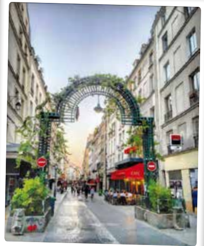
Une rue Montorgueil fleurie

Vous avez saisi un événement de notre arrondissement ? N'hésitez pas à nous adresser vos clichés par courriel à mairie02@paris.fr ou sur Instagram avec #Paris02. Et n'oubliez pas de suivre @Mairiedu2 !