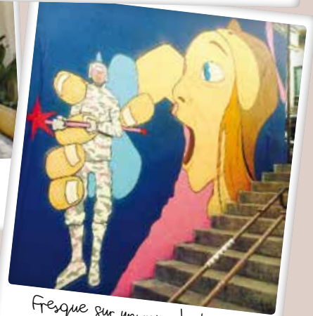
Fresque sur un mur de la rue la plus courte de Paris @plzenskaj