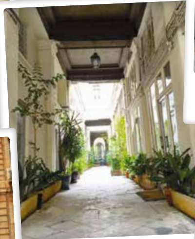
Beau passage rue Léopold-Bellan