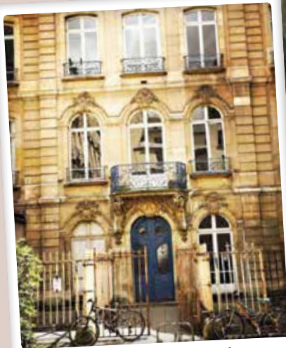
Le méconnu passage des Dames-de-saint-Chamond par @oliviasnaije