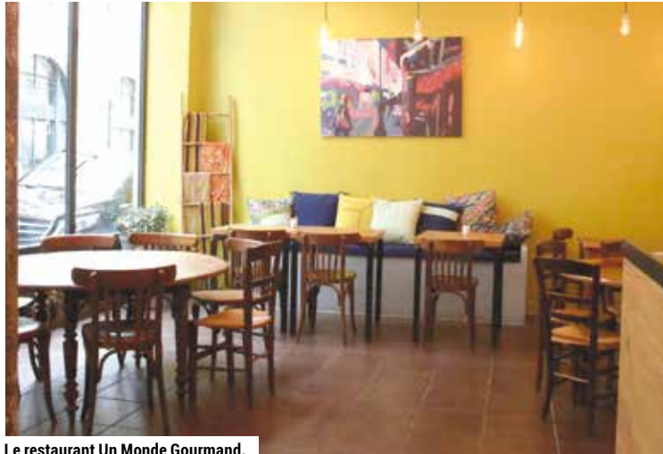
Le restaurant Un Monde Gourmand.

Une autre preuve que nos déchets sont nos nouvelles matières premières nous est donnée avec Moulino Compost & Biogaz. Comme son nom l'indique, cette société basée dans l'arrondissement valorise les biodéchets en compost et en bio-