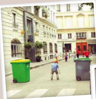
Foot endiable square Louvois

Vous avez saisi un événement de notre arrondissement ? N'hésitez pas à nous adresser vos clichés par courriel à mairie02@paris.fr ou sur Instagram avec #Paris02. Et n'oubliez pas de suivre @Mairiedu2 !