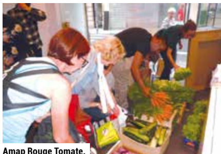
Amap Rouge Tomato.

« La restauration étant un milieu très exigeant, c'est un excellent support d'insertion professionnelle. »